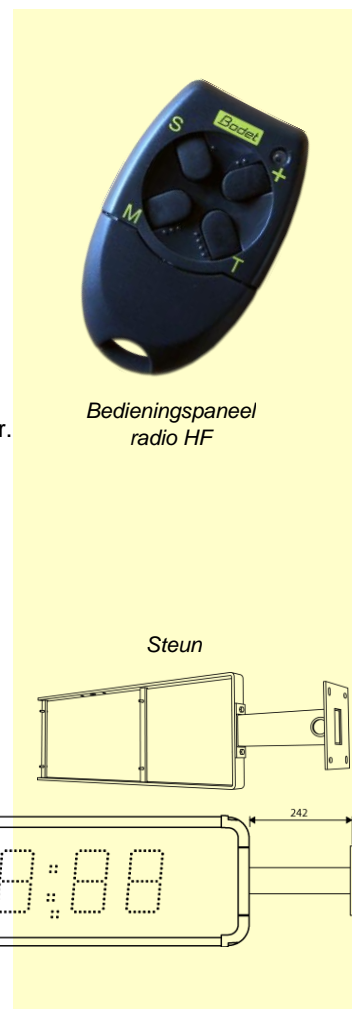
Bedieningspaneel radio HF